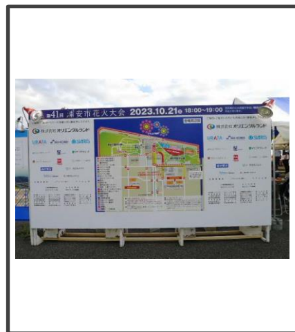
500万円～10万円コース 協賛社限定